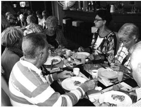
Dauwtrappen met daarna een heerlijk ontbijt